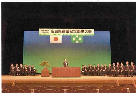
広島県産業安全衛生大会・開会式

協会長表彰の功労賞は、長年にわたり労働条件等の改善又は産業安全若しくは労働衛生の向上に尽力され、その功績が顕著な個人に贈られるものです。