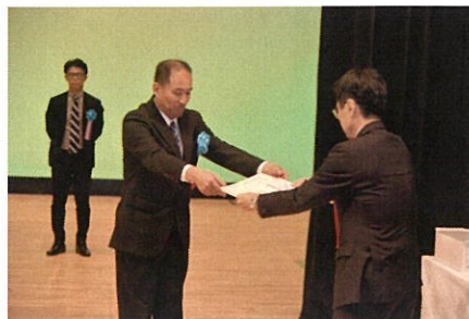
末國様 受賞の様子

主に、令和4年度で終了した「第13次労働災害防止推進計画」の主要目標の達成状況についてと、令和5年度より始まった「第14次労働災害防止推進計画」の概要、計画の重点事項をはじめ、8つの重点項目の具体的内容等についての説明がありました。