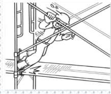
年齢階級別転倒、墜落・転落災害の発生割合(平成27年)