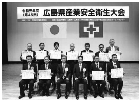
会長表彰を受賞された皆様