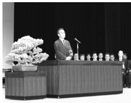
祝辞 中山 明広 広島労働局長

また、本年も会場内に職場の安全・衛生・快適を実現するための関連機器の「展示コーナー」、職場の安全衛生の「相談コーナー」を設け、多くの方にご利用いただきました。